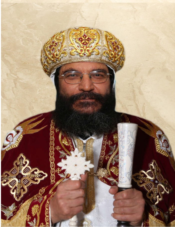
ΠΕΝΙΩΤ ΕΠΤΑΙΗΟΥΤ ΝΔΙΚΕΟC ΔΒΒΑ ΣΑΒΡΙΗΛ ΠΙΕΠΙCΚΟΠΟC ΝΤΕ ΔωΟΥCΤΡΙΑ S.E. Bischof Anba Gabriel Bischof von Österreich und dem deutschsprachigen Raum der Schweiz