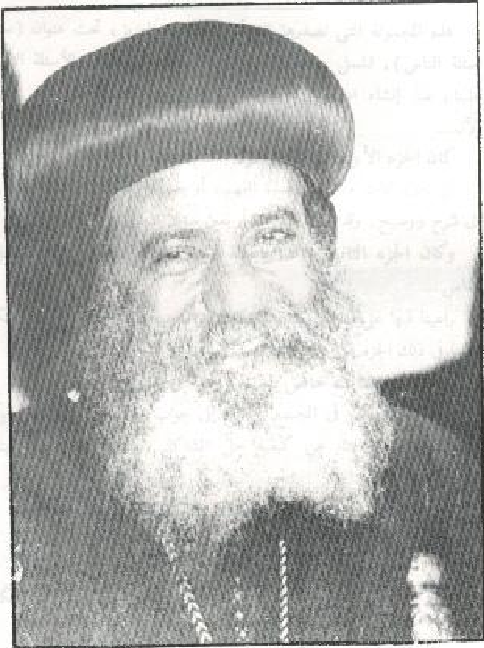
عمارة صامون القنطرة والغبطة البابا شنودة الثالث بابا الإسكندرية وبطرك الكرازة القسرية